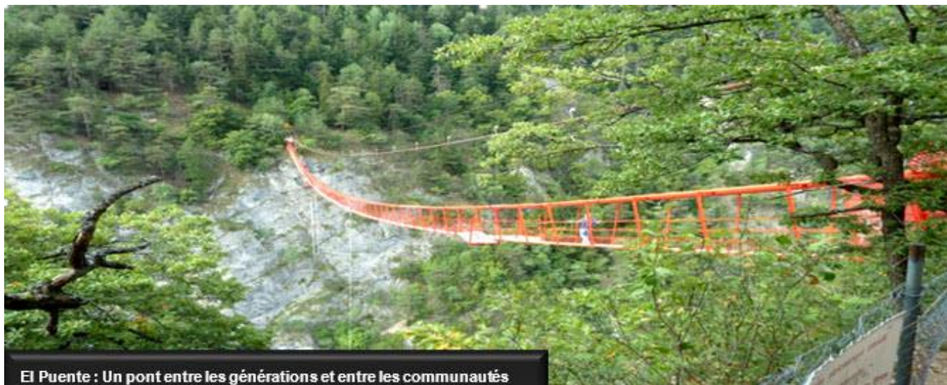
El Puente : Un pont entre les générations et entre les communautés