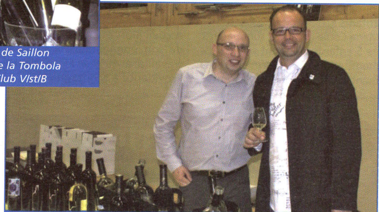
Les vignerons représentant les Caves Giroud et cave de la Bachole