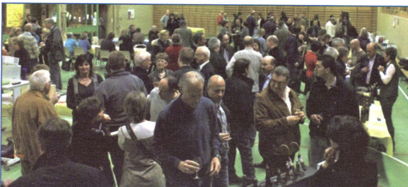
La salle de la Comba de Verbier est pleine pour cette soirée de bonnes actions du Rotary Club de Verbier st Bernard

telles que les associations «Le Baluchon» et «Le Lien», programmes d'aides aux familles de la vallée de Bagnes ainsi que l'association des malades atteints de la sclérose en plaque. Il participe également à d'autres structures plus internationales, notamment par son